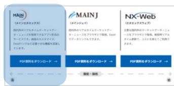
サービスラインナップ